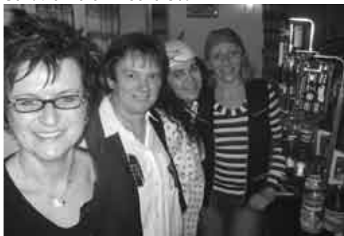
Das Bild zeigt unsere fleißigen Bardamen

Unser Faschingsball wurde wieder gemeinsam mit der Feuerwehr gefeiert. Die Band KAWOGL sorgte für die musikalische Stimmung. Auch die Betweiber verlegten ihren Kniestuhl wieder von der Kirche in das Schützenhaus und baten um Besserung für einige Personen und Vereine.