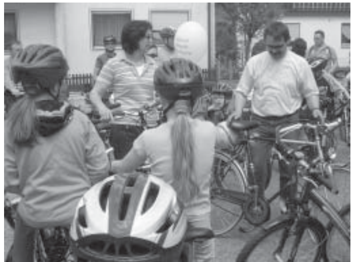
Das Foto zeigt die Gruppe bei den Startvorbereitungen.

Um 17.30 Uhr trafen die Familien nach einem abwechslungsreichen Nachmittag wieder in Berggau ein.